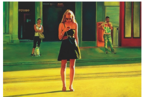
Silvia Gertsch, Late Afternoon , 2014, Öl auf Glas, 86 × 124 cm, Privatsammlung. © Silvia Gertsch / Foto: Bildkultur, Markus Mühlheim.

In ihren Werken manifestiert sich ihre übersteigerte Wahrnehmung der Realität, die sie vermeintlich banalen, bisweilen sogar langweiligen Alltagssituationen entnimmt. Sie lässt uns teilhaben an ihren Träumereien und ihrer Poesie. Bei ihren Bildthemen – stammen diese nun aus der Natur oder der Stadt und geben in sich ruhende Landschaften oder Menschen in Alltagssituationen wieder – spielt der radikale Kontrast von Licht, Farbe und Sujets immer eine dominierende Rolle. Ihre Werke schwanken zwischen einem entrückten Sichverlieren und einer bedingungslosen Unmittelbarkeit und schaffen es so, die Botschaft hinter dem gläsernen Bildträger auf den Punkt zu bringen. Dadurch strahlen die Hinterglasmalereien von Silvia Gertsch eine Aktualität aus und ermutigen uns zum Nachdenken, zum Mitfeiern und zum Eintauchen in eine lichtdurchflutete Welt des Hier und Jetzt.