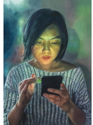
Silvia Gertsch, Shupei I, 2020, Öl auf Glas, 77 × 53 cm. © Silvia Gertsch / Foto: Bildkultur,

Die zusammen mit der Künstlerin getroffene Werkauswahl legt den Fokus auf Arbeiten bestimmter Schaffensphasen und Bildzyklen, die stets einen starken Licht- und Farbkontrast betonen. Gegenlicht wird als effektvolles Gestaltungselement eingesetzt. Dabei bieten die 30 im Vitromusée Romont präsentierten Exponate einen vertieften Blick auf das Kunstschaffen von Silvia Gertsch aus fünfzehn Jahren. Während im ersten Ausstellungssaal Hinterglasgemälde aus den Jahren 2007 bis 2019 gezeigt werden, sind im zweiten Ausstellungssaal Silvia Gertschs neuste Bildserien «Handy Girls» und «Golden Light» zu sehen.